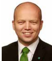
Trygve Slagsvold Vedum Leder i Senterpartiet

TEMA: – Det blir sagt at «alt vi lager av olje, kan vi også lage av tre». I skogressursene ligger store muligheter til å bidra til en bærekraftig og grønn økonomi, og til å utvikle et mer mangfoldig norsk næringsliv. Dette er et av temaene i regjeringens bioøkonomistrategi, som kom i fjor høst. Regjeringen har nettopp lagt frem stortingsmelding om en grønnere, smartere og mer nyskapende industri. Denne tar opp sentrale temaer som er viktige for videreutvikling av en konkurransedyktig skog- og trenæring i Norge, forteller Mæland om temaet for sitt foredrag.