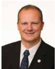
Ketil Solvik-Olsen Samferdselsminister

Samferdselsminister Ketil Solvik-Olsen (FrP) (45) er fra Sandnes i Rogaland. Han er utdannet innen sosialøkonomi og statsvitenskap ved universitet Toledo i USA. Solvik-Olsen har arbeidet for rederiet Leif Höegh og i Møller-gruppen utenom å være politiker på heltid. Han har vært aktiv i FrP siden han var 15 år og var i partiets stortingsgruppe før han ble valgt inn på Stortinget. Siden 2005 har han sittet i Stortingets energi- og miljøkomité. Som samferdselsminister har han profilert seg på sine mange vegprosjekter, også en stor økning i aktiviteten på skogsvegbygging og -restaurering.