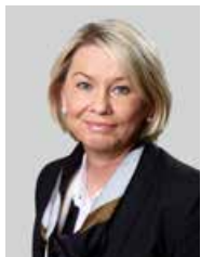
Monika Mæland Næringsminister

Samferdselsminister Ketil Solvik-Olsen (FrP) (45) er fra Sandnes i Rogaland. Han er utdannet innen sosialøkonomi og statsvitenskap ved universitet Toledo i USA. Solvik-Olsen har arbeidet for rederiet Leif Höegh og i Møller-gruppen utenom å være politiker på heltid. Han har vært aktiv i FrP siden han var 15 år og var i partiets stortingsgruppe før han ble valgt inn på Stortinget. Siden 2005 har han sittet i Stortingets energi- og miljøkomité. Som samferdselsminister har han profilert seg på sine mange vegprosjekter, også en stor økning i aktiviteten på skogsvegbygging og -restaurering.